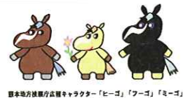
熊本地方検察庁広報キャラクター「ヒーゴ」「フーゴ」「ミーゴ」