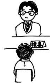
けんさつかん そうさ 検 察 官 の 捜 査