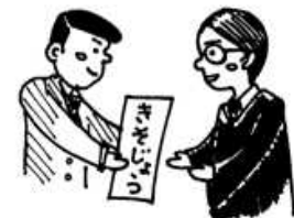
さいばんしょ きそ 裁 判 所 に 起 訴