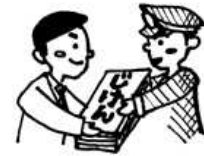
じけん ひつ 事件の引き継ぎ