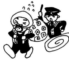
じけん はっせい 事件の発生

けいさつかん 警察官 かいじょうほあんかん 海上保安官 まやくとりしまりかん 麻薬取締官 その他