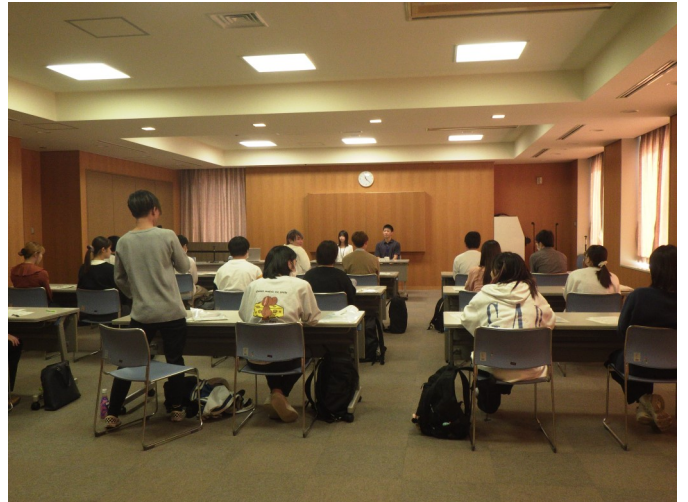
若手事務官（松山大学出身）との座談会の様子

10月12日（木）、松山大学法学部のゼミ生を当庁にお招きし、法教育を実施しました。