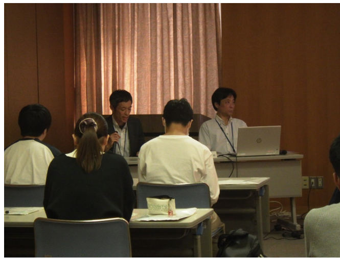
検察事務官による説明（刑事政策）の様子

検察庁は一般の方と接する機会が少ないため馴染みがありませんが、今回の法教育を通じて検察庁の業務に興味を持っていただき、就職先の候補としていただくと幸いです。貴重な機会をいただき、ありがとうございました。