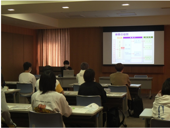
検察官による法教育の様子