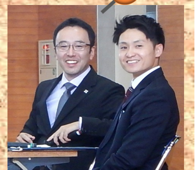
♪ 広報活動中の若手職員と筒井副検事♪