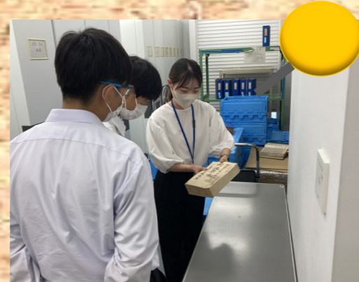
♪ 楽しく真面目に広報活動してます♪