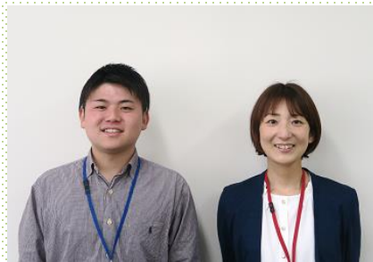
副検事(右) 検察事務官(左)ペア