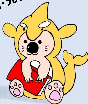
名古屋地方検察庁 マスコットキャラクター 鯨あ郎